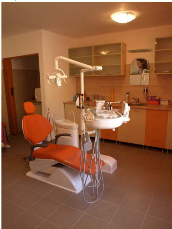
Cabinetul stomatologic din cadrul Centrului Socio-medical Sector 6

medical, compus dintr-un cabinet stomatologic și unul oftalmologic, unde pensionarii, persoanele cu venituri mici, copiii defavorizați vor putea primi tratament medical gratuit sau parțial subvenționat. Putem aprecia acest centru medical o mare reușită, un program menit să vină în sprijinul celor care nu pot accesa acest tip de tratamente medicale, care pentru foarte mulți cetățeni ar reprezenta eforturi financiare peste puterile lor. Estimăm că anual peste 1500 de persoane vor beneficia de tratamente stomatologice și oftalmologice gratuite.